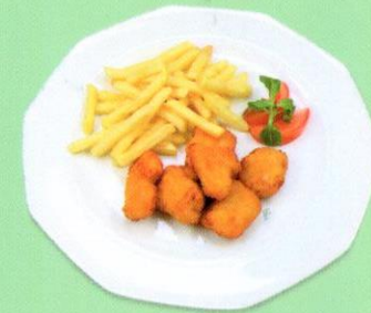
Pouletknusperli mit Pommes Frites CHF 8.50