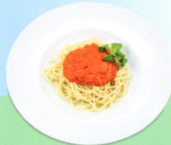
Nudeln mit Tomatensauce CHF 7.50