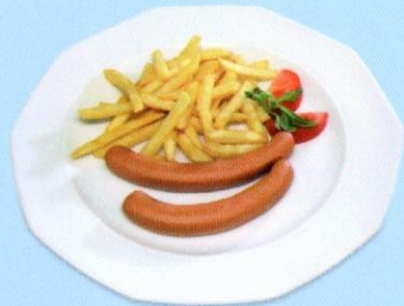
Wienerli mit Pommes Frites CHF 8.50