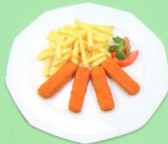
Fischstäbli Fischstäbchen mit Pommes Frites CHF 8.50