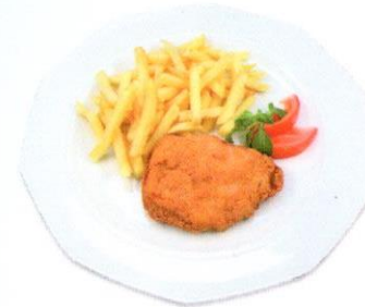
Paniertes Schweinsschnitzel mit Pommes Frites CHF 10.50