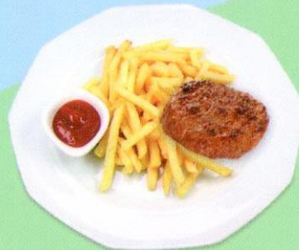
Hamburger Hamburger mit Pommes Frites CHF 9.50