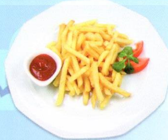
Portion Pommes Frites CHF 6.00